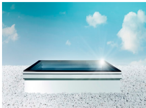
Skylux - Ventana para cubierta Plana Zocalo recto