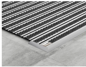
Novomat slimm Felpudo