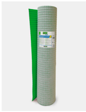
Green Pro Membrana impermeable antifractura