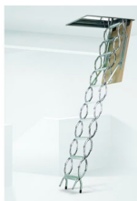
Escalera Escamoteable Tijera Metalica Galvanizada ZX