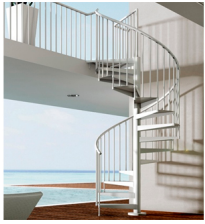
Escalera Caracol F20ZV Maydos