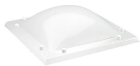
Cupula Exterior metacrilato alto impacto