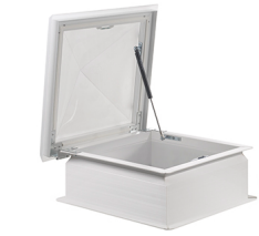
Claraboya zocalo recto