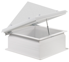
Claraboya zocalo recto