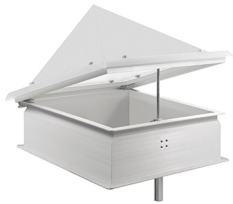
Claraboya zocalo recto