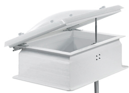
Claraboya zocalo recto