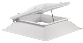
Claraboya apertura por Husillo